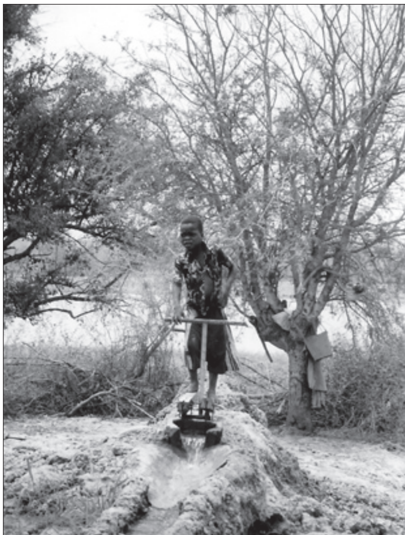
► Canale di irrigazione, grazie ad una pompa a pedali fornisce l'acqua ai campi di coltivazione

si interroga sulla sostenibilità, sugli impatti ambientali, sui processi culturali che i propri processi produttivi possono mettere in crisi. Anche la cooperazione per troppo tempo non si è posta in modo critico verso questa linearità di pensiero. Troppe «cattedrali nel deserto» sono state realizzate in nome dello sviluppo; pochi gli interventi nel rispetto dell'uomo, dell'ambiente, delle culture e della globalità della vita nella molteplicità delle sue espressioni e differenze.