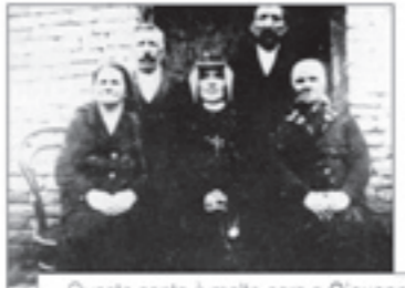
Questa santa è molto cara a Giovanni Paolo II, che l'aveva conosciuta a Cracovia. Lui stesso l'ha beatificata nel 1993 e poi canonizzata il 30 aprile 2000

Una vita che è stata il tempo di un'azione e di una vita. Una vita che è stata il tempo di un'azione e di una vita. Una vita che è stata il tempo di un'azione e di una vita.