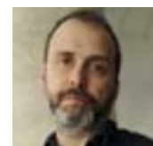
di CRISTIANO PROIA

È un ricordo di qualche anno fa, ma abbastanza nitido. Avevo partecipato a un corso di psicologia impresariale in cui il docente aveva utilizzato, per semplificare alcuni