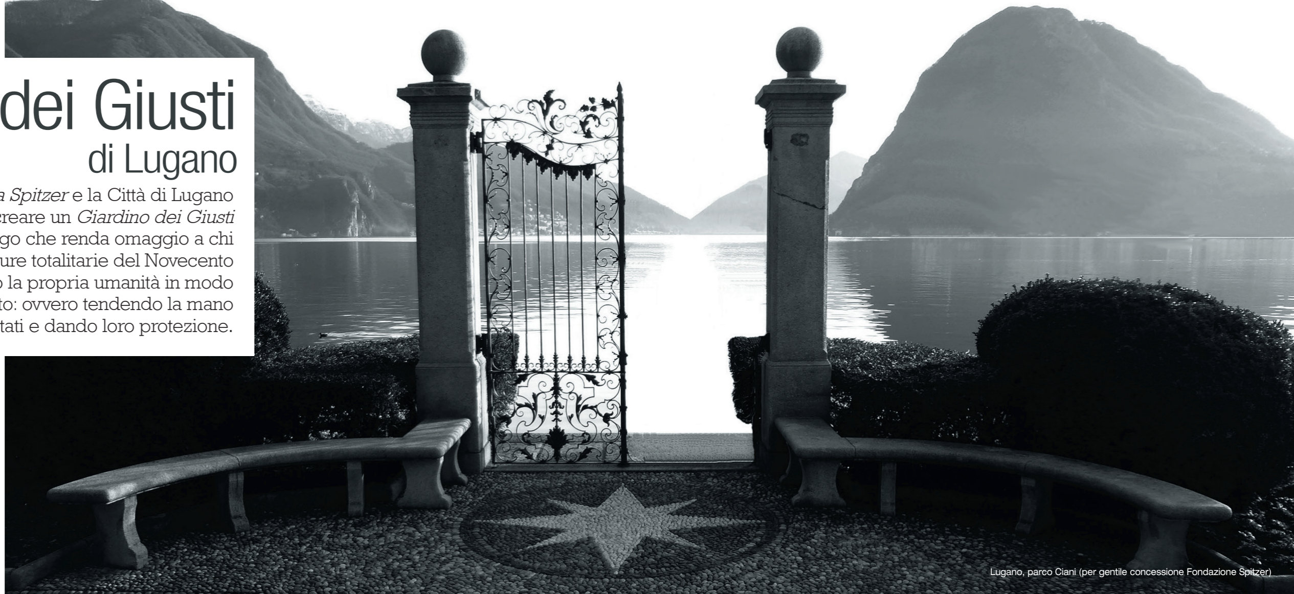
Lugano, parco Ciani

sopra logo del progetto "Lugano città aperta", www.luganocittaaperta.ch