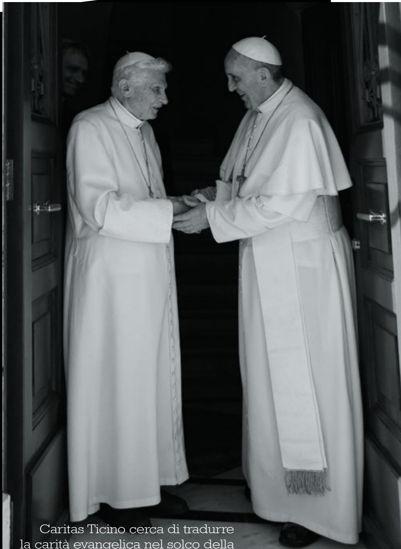
Caritas Ticino cerca di tradurre la carità evangelica nel solco della Dottrina Sociale della Chiesa

si demanda ad altri la propria responsabilità, incoraggiati da una cultura assistenzialista e del diritto acquisito. A questa situazione contribuiscono molti fattori, virtualità della spesa, difficoltà di pianificazione a lungo termine, scarso controllo sulle spese effettive, solo per citarne alcuni, che tuttavia, da soli non spiegano il fenomeno.