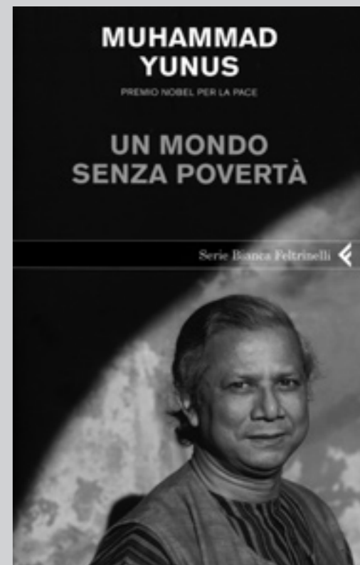
► Muhammad Yunus. Un mondo senza povertà, Milano, Feltrinelli, 2008

In particolare egli sostiene che vi siano alcuni assiomi economici, alcuni presupposti, che sono dannosi, non perché eticamente scorretti, ma perché non rispondono effettivamente alle esigenze della crescita dell'uomo e, inoltre, anche dal punto di vista strettamente economico, finiscono per far implodere il mercato, come la recente crisi finanziaria ha messo in luce.