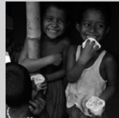
► Bambini in Bangladesh mangiano Shoktidoi yogurt Lo yogurt arricchito con vitamine prodotto dalla Grameen-Danone

Anch'egli è consapevole che esiste un reale problema dello sviluppo senza limiti e l'ultima parte del suo volume è ampiamente dedicata alla questione ambientale, ma,