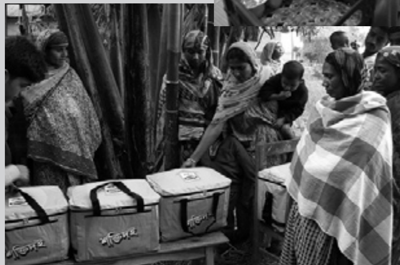
► Distribuzione da parte delle donne dei vasetti di yogurt con borse termiche