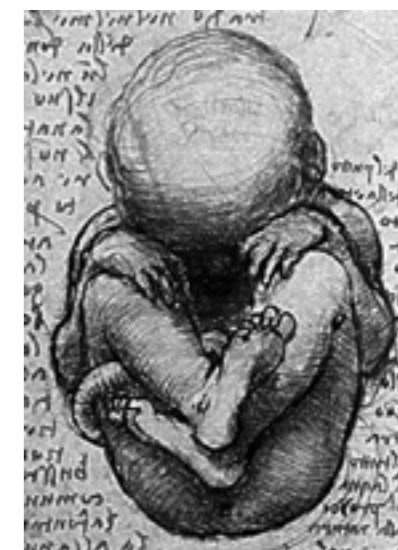
► Feto umano in un disegno di Leonardo da Vinci