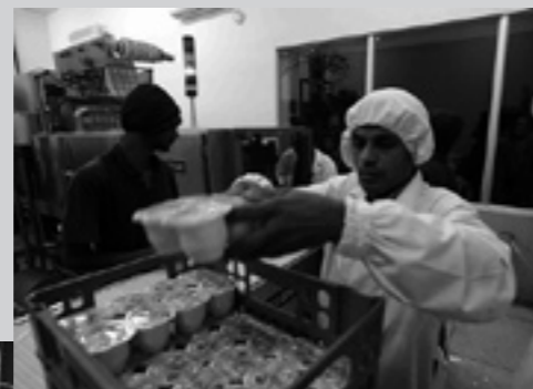
► Fabbrica di yogurt Grameen Danone a Bogra, in Bangladesh