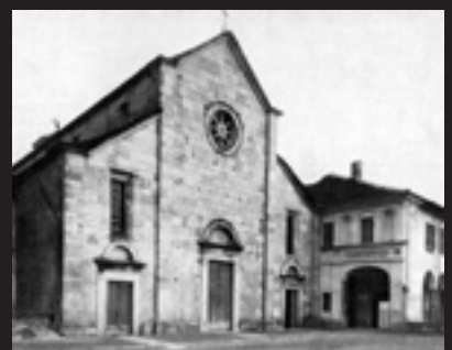
▲ Chiesa Santa Croce a Riva San Vitale

Pur nell'incertezza della paternità dell'opera, è sicuro che l'autore del progetto, piegandosi al volere della committenza, adattò il suo linguaggio artistico, aggiornato ai canoni rinascimentali, al desiderio dei frati di realizzare un edificio ecclesiale che rispecchiasse, per ragioni di continuità culturale e istituzionale imposte dall'ordine, la chiesa considerata modello per