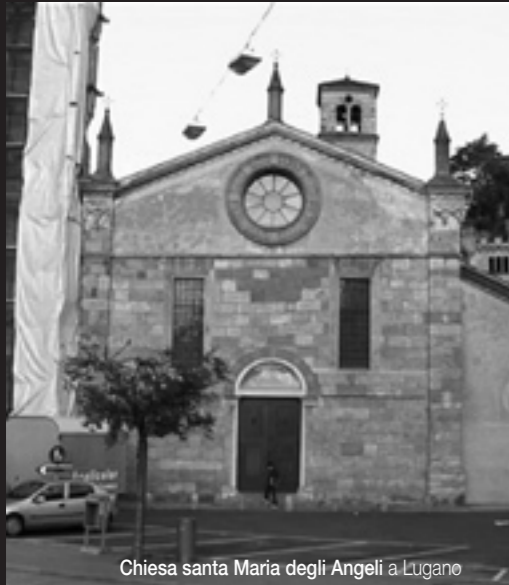
Chiesa santa Maria degli Angeli a Lugano

S eppur con un lieve ritardo, il Ticino fu partecipe della nuova temperie culturale portata dal Rinascimento, che, nato in Italia, fu un fenomeno di portata europea, e si dispiegò lungo i secoli XIV, XV e XVI.