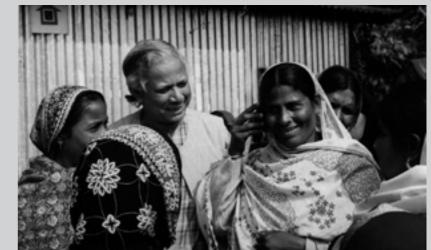
► Muhammad Yunus con alcune "signore telefono"

Yunus forse non approverebbe questa definizione, da economista e musulmano, ma nel suo modo di pensare all'economia con la capacità di vedere ciò che altri non vedono, nei problemi una risorsa, nell'attenzione ai dettagli la possibilità di un cambiamento epocale, nella capacità di cambiare un sistema dall'interno e senza voler creare un'economia alternativa, ma, semmai, un'alternativa nell'economia, non si può che definire se non come il "carisma" all'opera nel mondo. ■