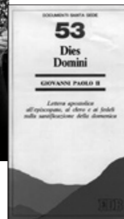
► Dies Domini, lettera apostolica di Giovanni Paolo II, ed. EDB