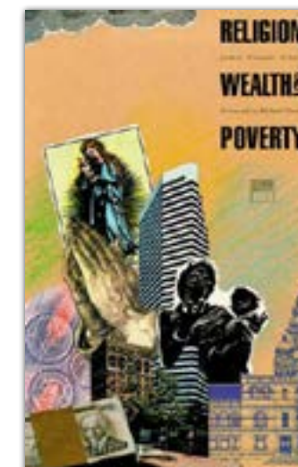
Religion, wealth and poverty, copertina, 1990

“La preoccupazione per i poveri è un elemento centrale del Cristianesimo. Tuttavia, il nostro modo di affrontare il problema della povertà non nasce dalla dottrina sociale cristiana ma dalla struttura umanitaria dominante dei nostri giorni: questo induce ad attuare strategie politiche ed economiche che si rivelano deleterie per qualsiasi reale prospettiva di aiuto, in quanto non toccano le esigenze concrete dell'essere umano. Oggi è quanto mai necessario un nuovo modo di pensare i poveri, cioè non come oggetti passivi, bensì come soggetti e protagonisti del proprio sviluppo, integrandoli in economie di mercato floride per l'accrescimento del bene comune”