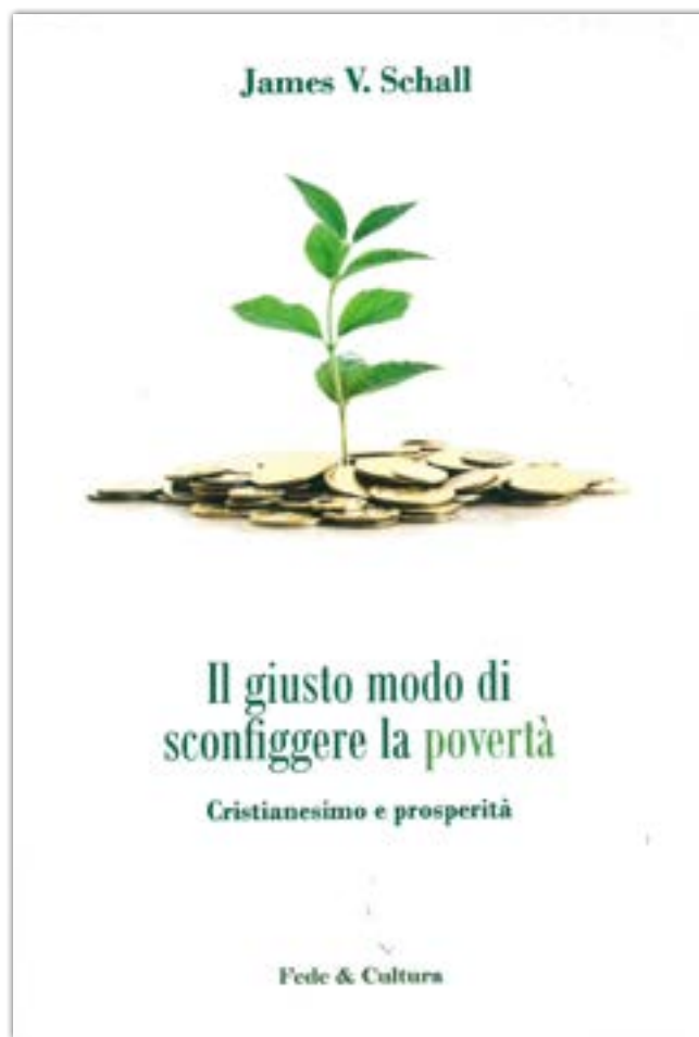
Il giusto modo di sconfiggere la povertà, copertina, 2017

Il giusto modo di sconfiggere la povertà. Cristianesimo e prosperità, di James Vincent Schall, (ediz. Fede & Cultura, 2017)